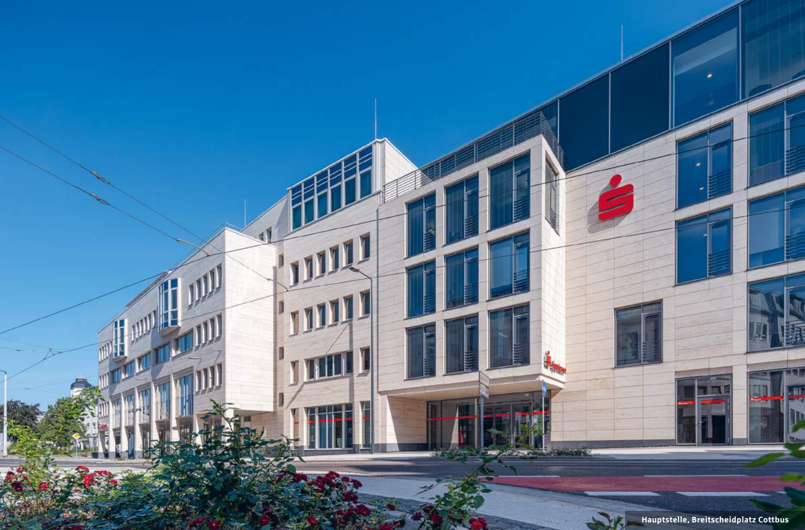
Hauptstelle, Breitscheidplatz Cottbus