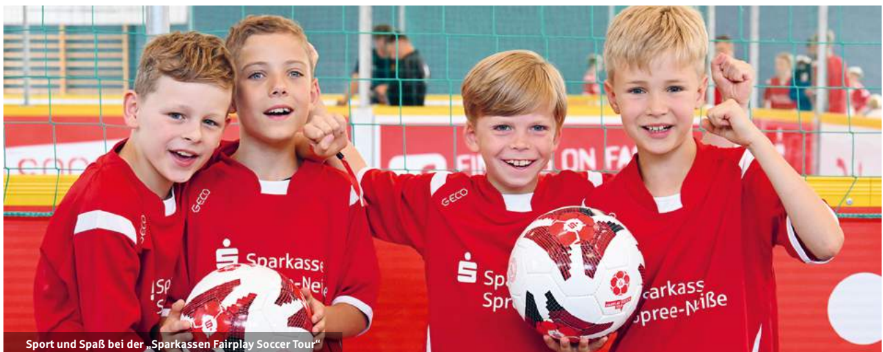
Sport und Spaß bei der „Sparkassen Fairplay Soccer Tour“

Auch bei der Förderung des Sports in der Region ist auf die Sparkasse immer Verlass. Die kontinuierliche Unterstützung des Nachwuchses ist Basis für erstklassigen Spitzensport. Seit vielen Jahren fördern wir die Top-Athleten des Olympiastützpunktes Brandenburg und der Lausitzer Sportschule Cottbus, eine der über 43 bundesweiten Eliteschulen des Sports. Dank unseres Engagements erlebt das sportbegeisterte Publikum jedes Jahr erstklassige Höhepunkte, wie z.B. die hochrangigen Wettkämpfe der Weltklassesprinter auf der Cottbuser Radrennbahn.